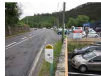
Le Pont Pessil

Un chemin piéton va être créé de l'embranchement de la route de Mende jusqu'à l'entrée de l'ancienne tannerie. Les travaux seront réalisés par les services techniques de la commune et l'entreprise Somatra courant septembre. Le revêtement de surface sera à la charge du Conseil Départemental.