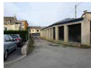
Allée des Soupirs, Impasse au droit de la résidence Rey, Quai des 4 roues

Chantier du programme voirie communauté de communes 2016 prévu de fin août à mi-septembre. Remise en état du revêtement de surface.